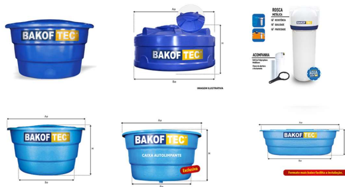
IMAGEM 4 a 9 – PRODUTOS DA MARCA – LINHA CAIXAS D'ÁGUA