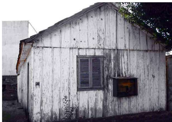
IMAGEM 2 – FOTOGRAFIA DA SEGUNDA FÁBRICA INSTALADA EM FREDERICO WESTPHALEN, RS (400M 2 )