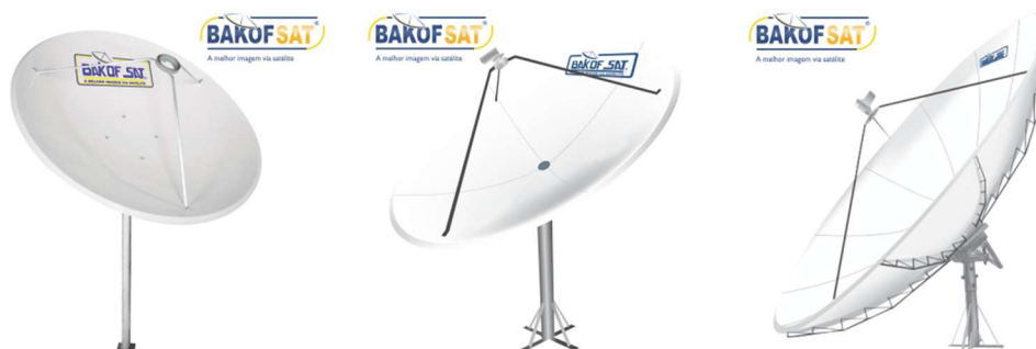
IMAGEM 36 a 38 – PRODUTOS DA MARCA – LINHA SAT