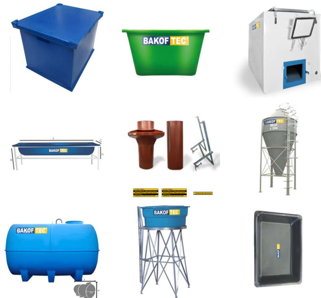
IMAGEM 27 a 35 – PRODUTOS DA MARCA – LINHA ESPECIAL