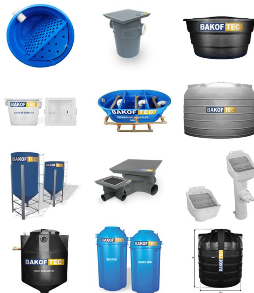
IMAGEM 10 a 21 – PRODUTOS DA MARCA – LINHA AMBIENTAL