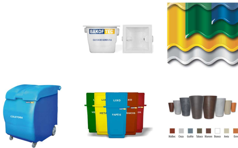
IMAGEM 22 a 26 – PRODUTOS DA MARCA – LINHA DOMÉSTICA